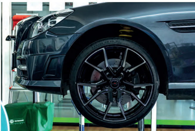
Die hinter den kraftvoll gezeichneten HUB Car-Felgen befindliche Bremsanlage besitzt gelochte Scheiben.

Auch hinsichtlich des im Bug befindlichen, 1,8 Liter großen M271-Turbo-Vierzylinders kam es zu einer Optimierung: Statt seiner werkseitigen 204 PS und 310 Nm generiert das Aggregat nun sogar 249 PS und 372 Nm. Darüber hinaus brachte Hub Car das Getriebe durch eine Spülung wieder auf Vordermann. Abrundend erhielt der Roadster ein Dachmodul, welches den Funktionsumfang des Daches erweitert und so beispielsweise eine fernbediente Öffnung, eine One-Touch-Bedienung und