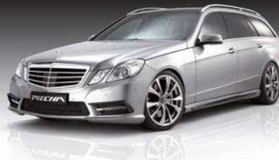
▷ E-Klasse Piccha