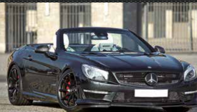
▷ SL R231 CruzDesign