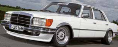
▷ 450 SEL W116