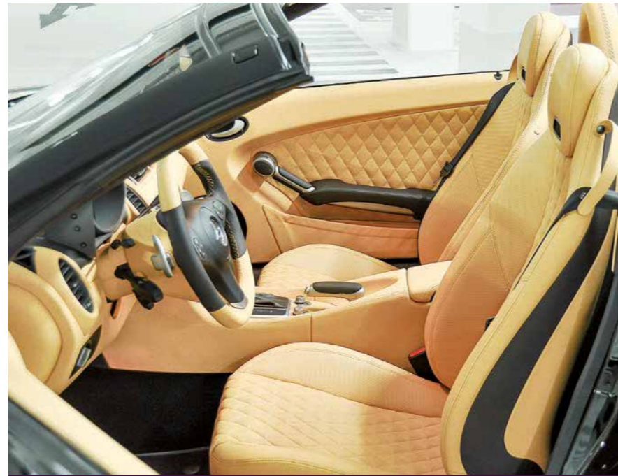
Leder-Wunderland: Das komplette Cockpit des SLK55 wurde von den Designern von Hub-Car bis ins letzte Detail mit hell- sowie dunkelbraunem Leder bezogen. Ein besonders exklusives Flair entsteht durch das abgesteppte Rautenmuster!