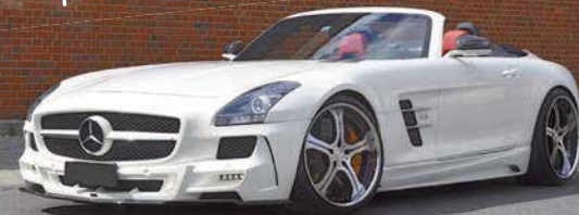
SLS63 AMG HS Motorsport