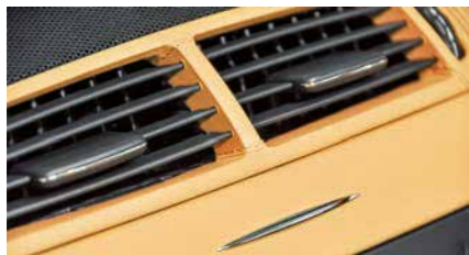
Leder bis ins letzte Detail: Sogar die Lüftungsöffnungen im Cockpit wurden komplett mit feinstem Leder bezogen!