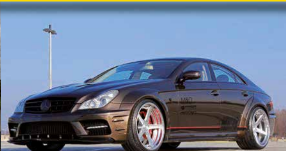
Made in Perfection