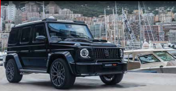
Brabus 700 Widestar