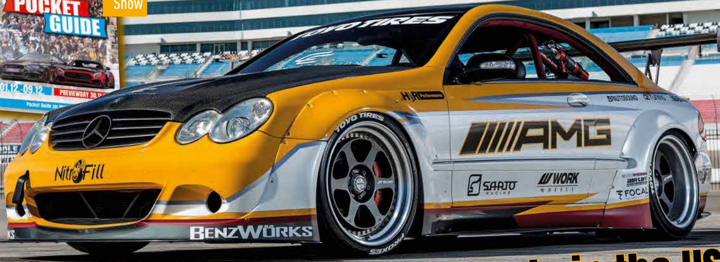
CLK 55 AMG