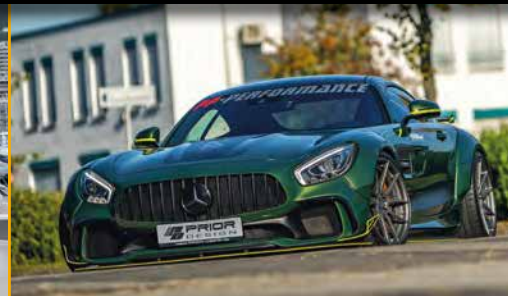
Mercedes-AMG GT fostla.de